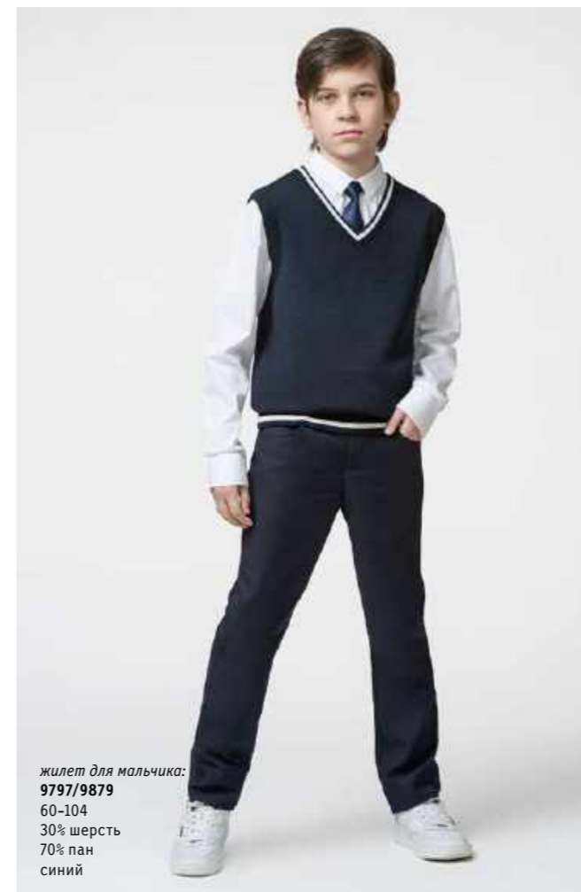
жилет для мальчика: 9797/9879 60-104 30% шерсть 70% пан синий