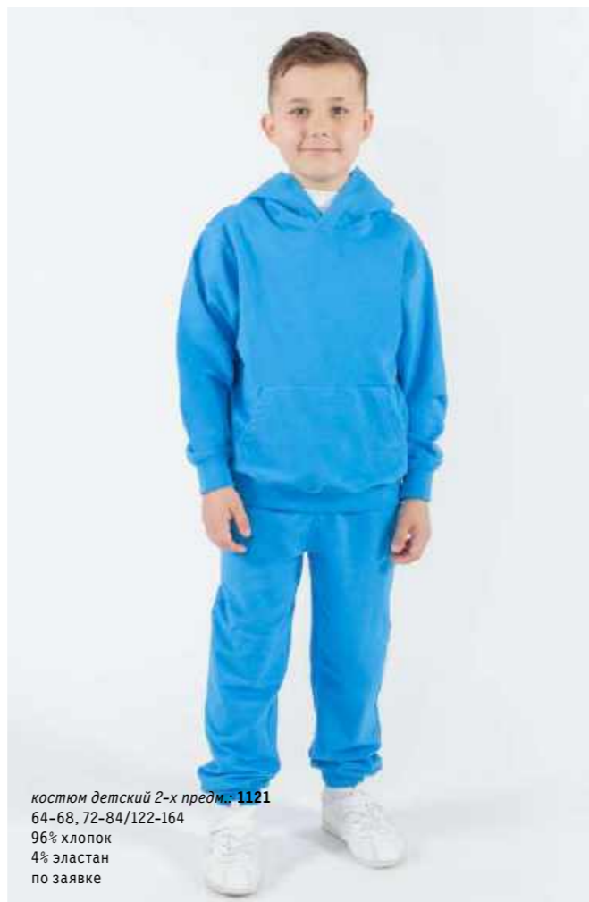
костюм детский 2-х предм.: 1121 64-68, 72-84/122-164 96% хлопок 4% эластан по заявке