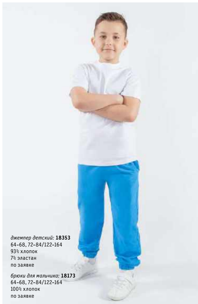
джерпер дeтский: 18353 64-68, 72-84/122-164 93% хлопок 7% эластан по заявке