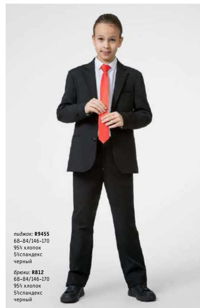
пиджак: R9455 68-84/146-170 95% хлопок 5% спандекс черный брюки: R812 68-84/146-170 95% хлопок 5% спандекс черный

COMINTERN – это одежда для тех, кто ценит лаконичность, стиль и практичность.