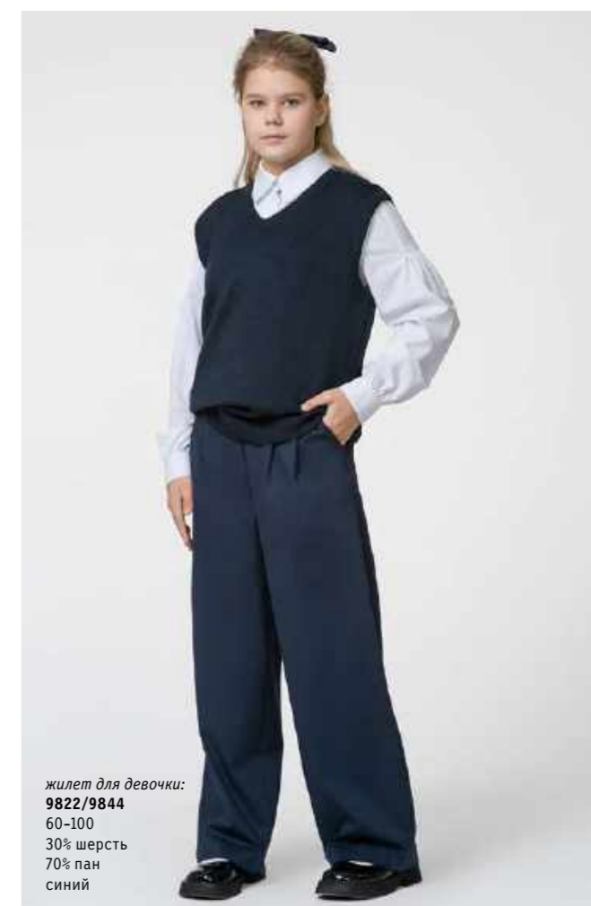
жилет для девочки: 9822/9844 60-100 30% шерсть 70% пан синий