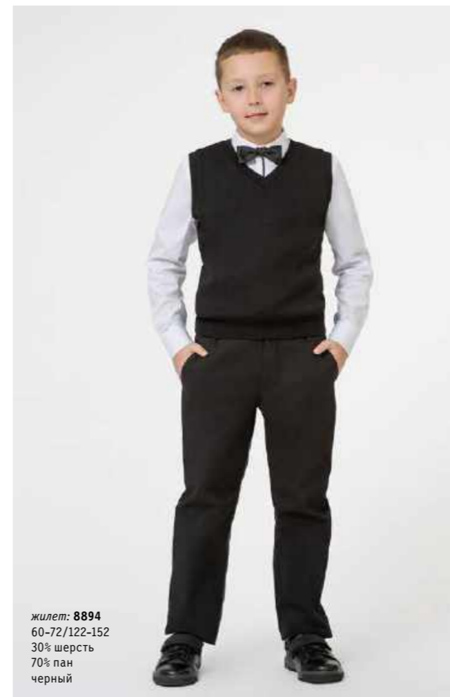
жилет: 8894 60-72/122-152 30% шерсть 70% пан черный

Все изделия выполнены из высококачественных натуральных материалов с добавлением шерсти, обеспечивая детям комфорт и свободу движения.