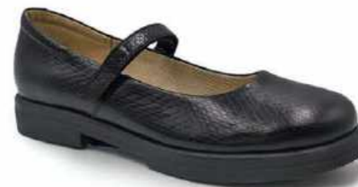
полуботинки для школьников-девочек: 64/74646

31-37 натуральная кожа натуральная кожа тэп