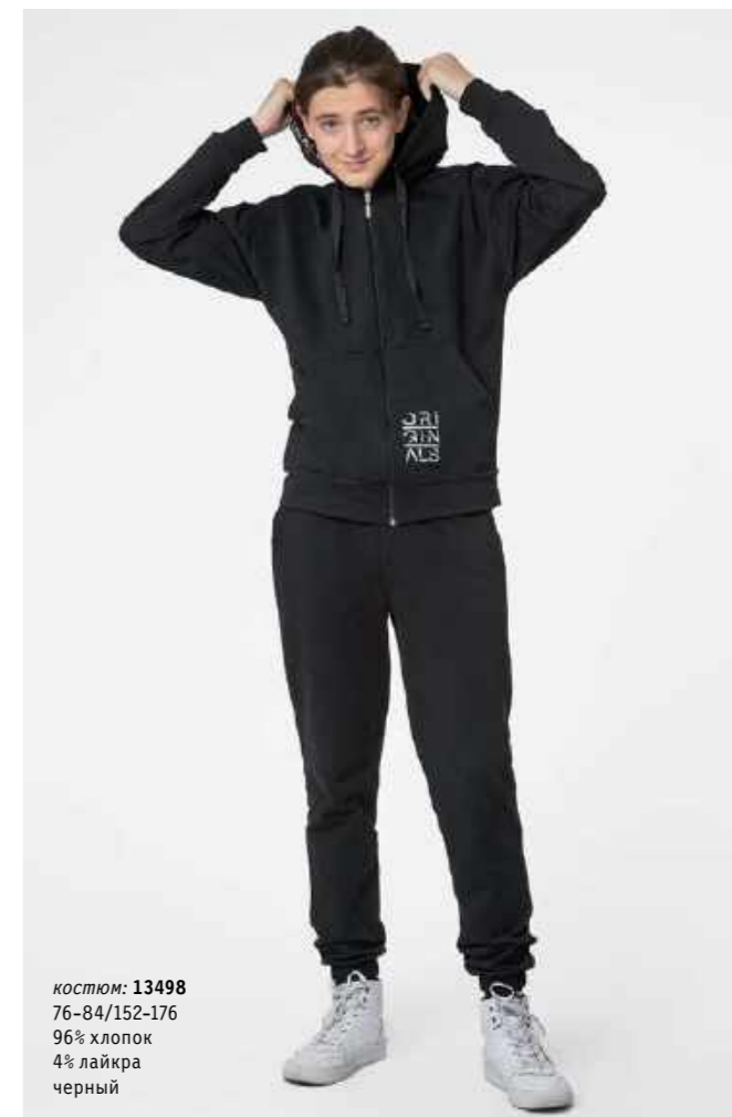
костюм: 13498 76-84/152-176 96% хлопок 4% лайкра черный