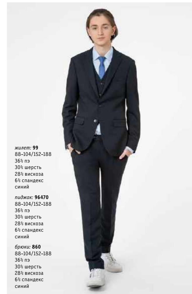
жилет: 99 88-104/152-188 36% пэ 30% шерсть 28% вискоза 6% спандекс синий пиджак: 96470 88-104/152-188 36% пэ 30% шерсть 28% вискоза 6% спандекс синий брюки: 860 88-104/152-188 36% пэ 30% шерсть 28% вискоза 6% спандекс синий