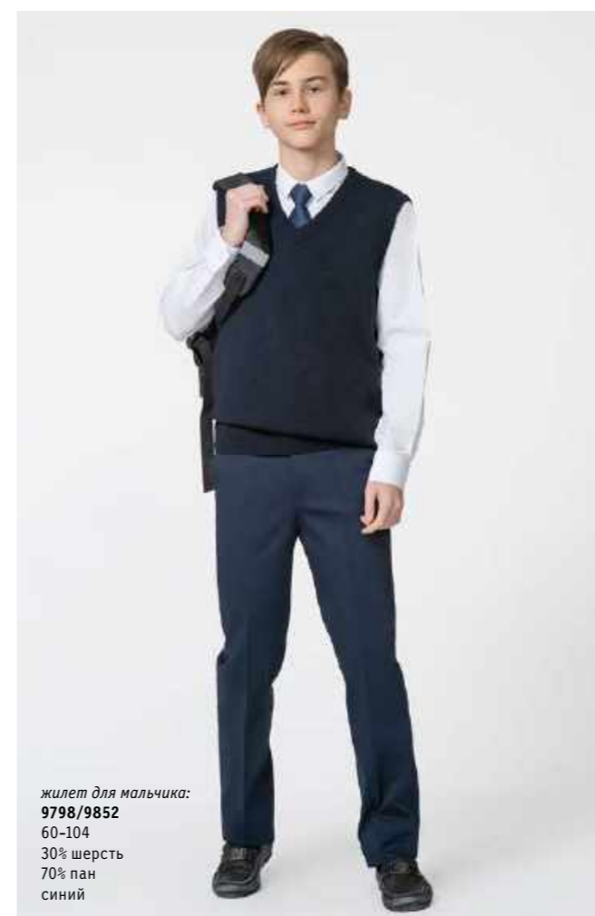
жилет для мальчика: 9798/9852 60-104 30% шерсть 70% пан синий

Ассортимент представлен однотонными жилетами и жилетами с полоской по горловине и низу изделия, а также жакетами с белой полосой. Модели выпускаются из полушерстяной пряжи в матросско-синем цвете.