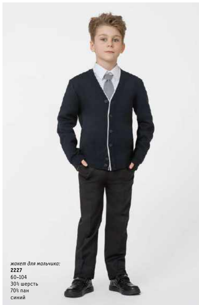
жакет для мальчика: 2227 60-104 30% шерсть 70% пан синий