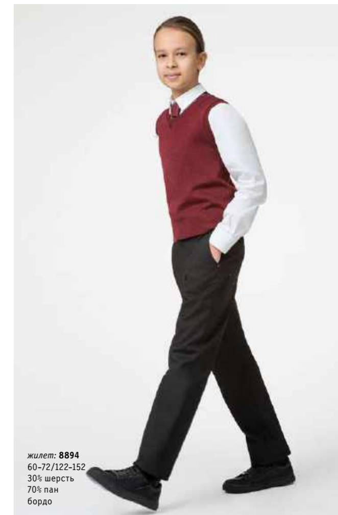
жилет: 8894 60-72/122-152 30% шерсть 70% пан бордо