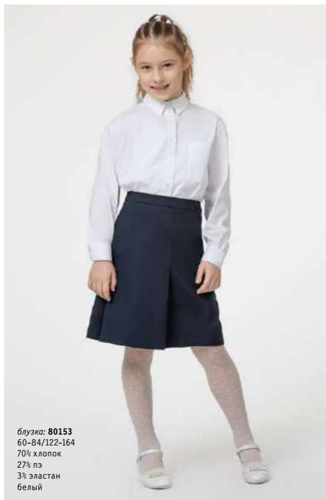
блузка: 80153 60-84/122-164 70% хлопок 27% пэ 3% эластан белый