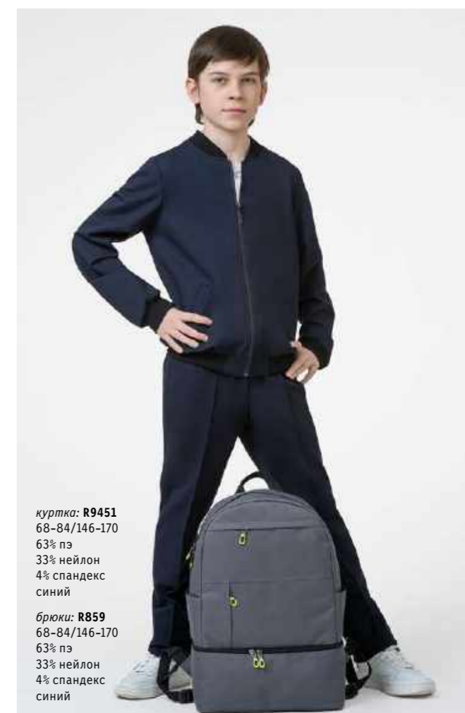
куртка: R9451 68-84/146-170 63% пэ 33% нейлон 4% спандекс синий брюки: R859 68-84/146-170 63% пэ 33% нейлон 4% спандекс синий