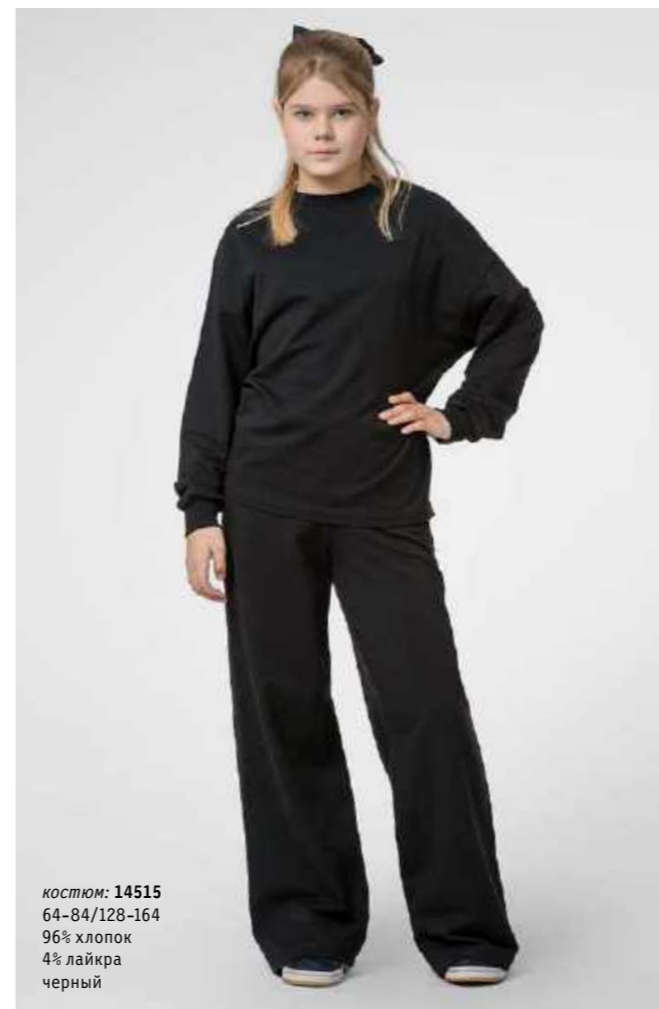
костюм: 14515 64-84/128-164 96% хлопок 4% лайкра черный