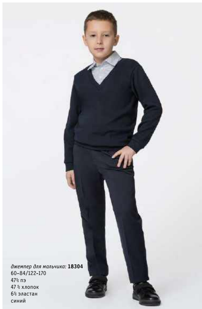
джерпер для мальчика: 18304 60-84/122-170 47% пэ 47% хлопок 6% эластан синий