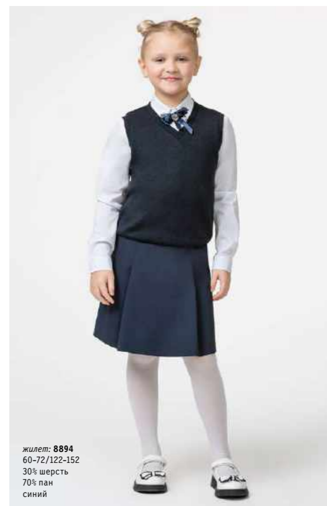
жилет: 8894 60-72/122-152 30% шерсть 70% пан синий