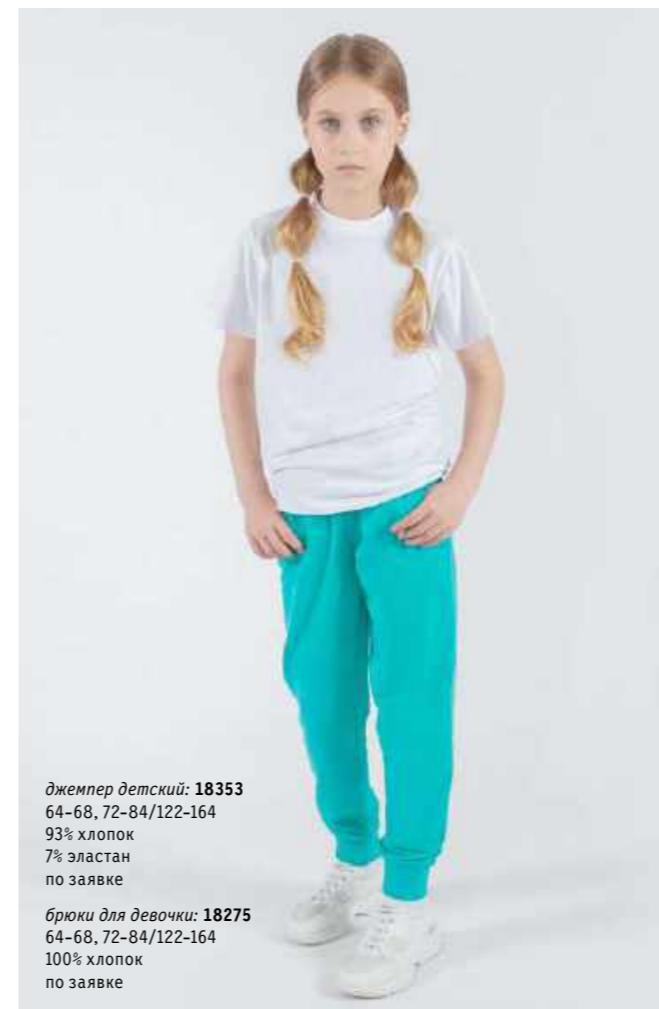
джерпер дeтский: 18353 64-68, 72-84/122-164 93% хлопок 7% эластан по заявке