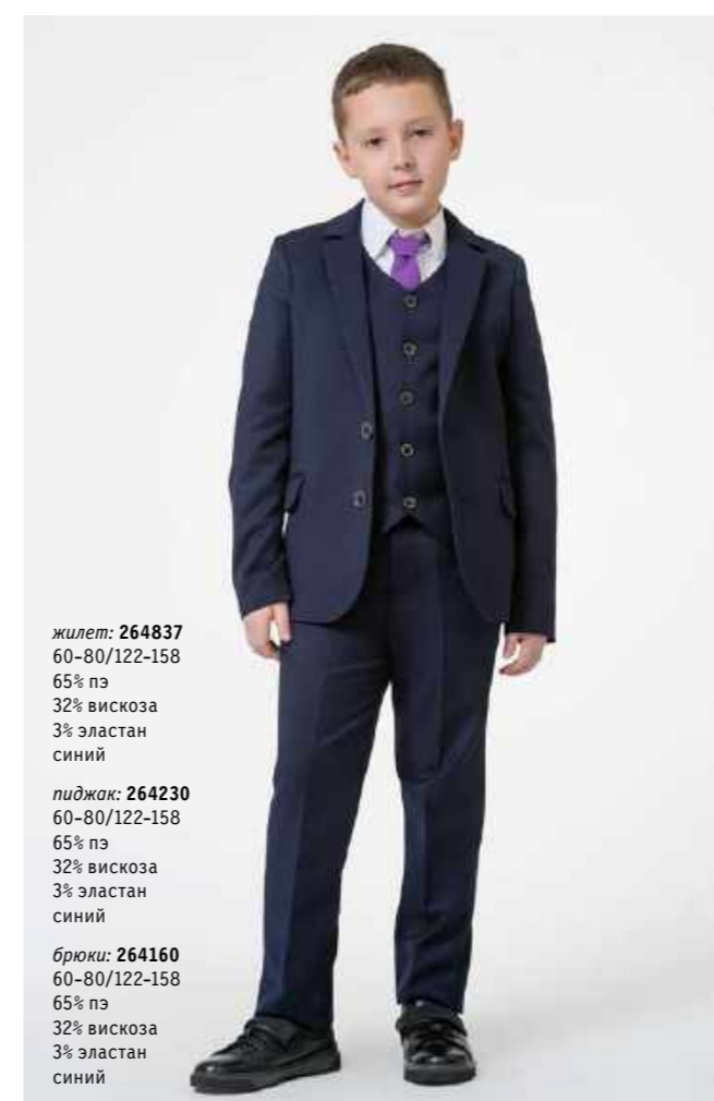
жилет: 264837 60-80/122-158 65% пэ 32% вискоза 3% эластан синий

Наша коллекция школьной формы – это не просто одежда, это возможность для каждого ученика выразить свою индивидуальность и чувствовать себя уверенно в школе. Мы стремимся предоставить нашим клиентам лучшее сочетание стиля, комфорта и качества.