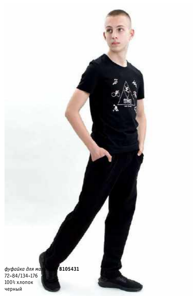
фудайка для мальчика: B105431 72-84/134-176 100% хлопок черный