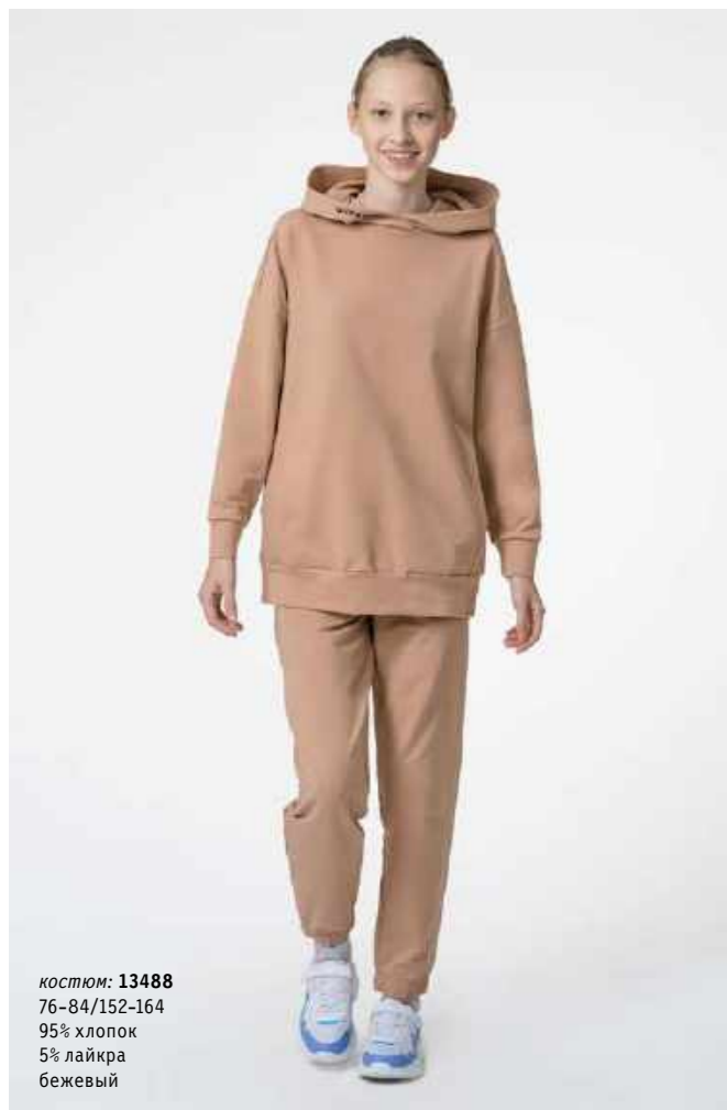
костюм: 13488 76-84/152-164 95% хлопок 5% лайкра бежевый