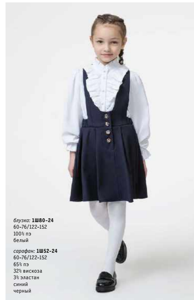
блузка: 1Ш80-24 60-76/122-152 100% пэ белый сарафан: 1Ш52-24 60-76/122-152 65% пэ 32% вискоза 3% эластан синий черный