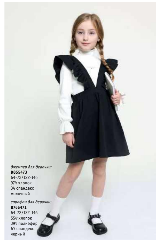
джерсер для дівочки: В855473 64-72/122-146 97% хлопок 3% спандекс молочный