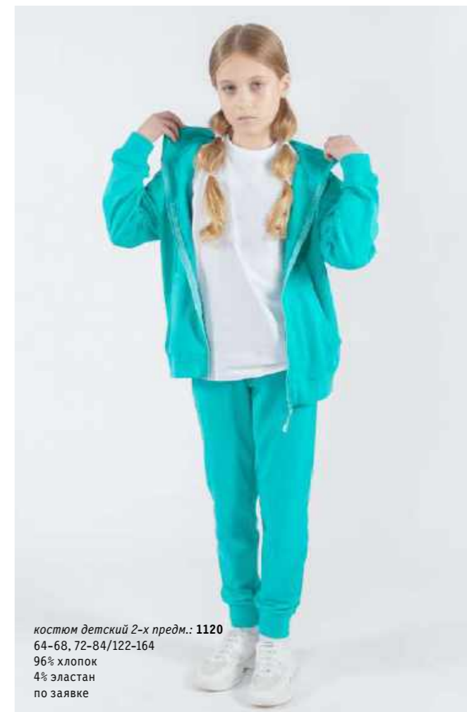
костюм детский 2-х предм.: 1120 64-68, 72-84/122-164 96% хлопок 4% эластан по заявке