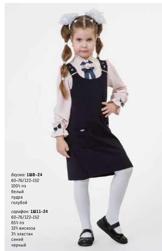
блузка: 1Ш8-24 60-76/122-152 100% пэ белый пудра голубой сарафан: 1Ш11-24 60-76/122-152 65% пэ 32% вискоза 3% эластан синий черный

С брендом TAMMI девочки выделяются стилем и элегантностью свойственным только истинным леди.