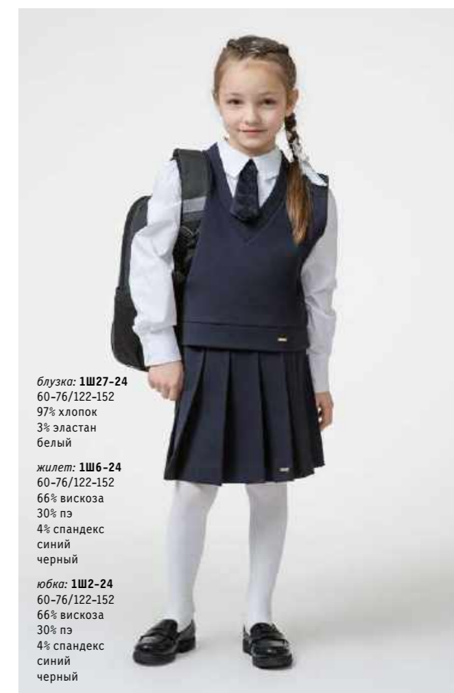
блузка: 1Ш27-24 60-76/122-152 97% хлопок 3% эластан белый жилет: 1Ш6-24 60-76/122-152 66% вискоза 30% пэ 4% спандекс синий черный юбка: 1Ш2-24 60-76/122-152 66% вискоза 30% пэ 4% спандекс синий черный