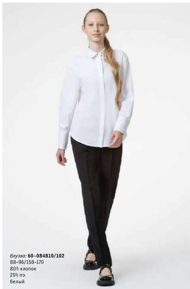
блузка: 60-084810/102 88-96/158-170 80% хлопок 20% пэ белый