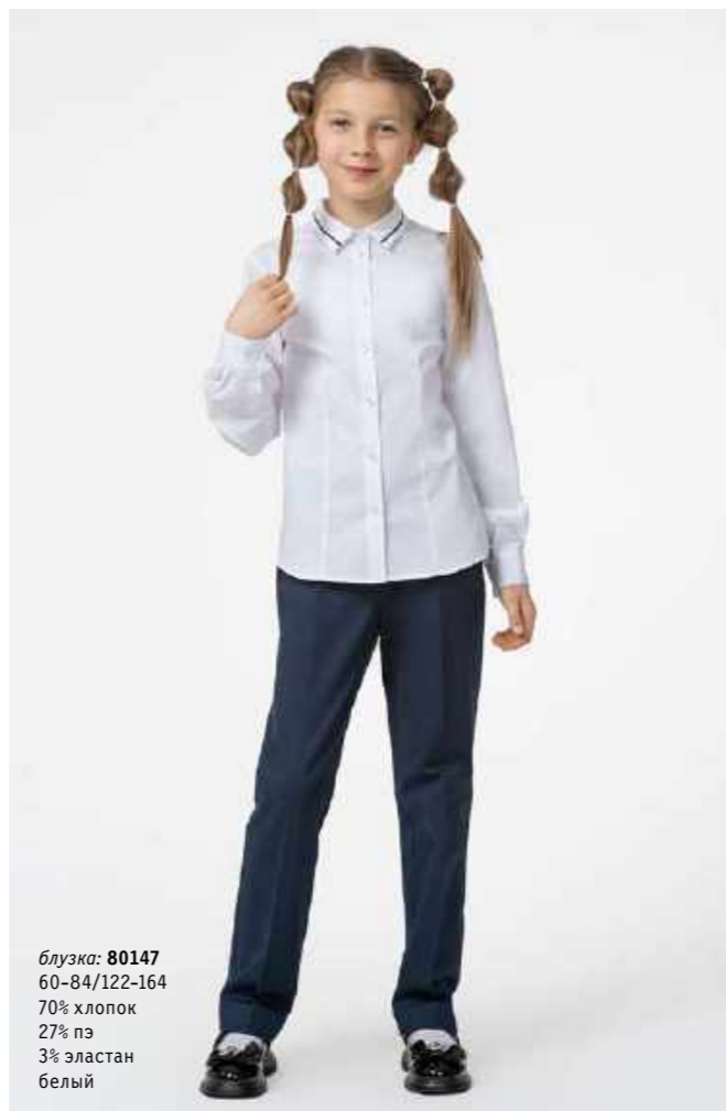
блузка: 80147 60-84/122-164 70% хлопок 27% пэ 3% эластан белый