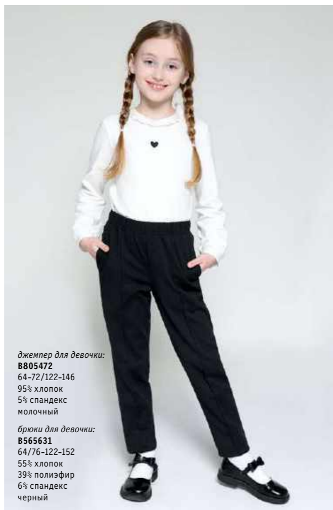
джерсер для дівочки: В805472 64-72/122-146 95% хлопок 5% спандекс молочный