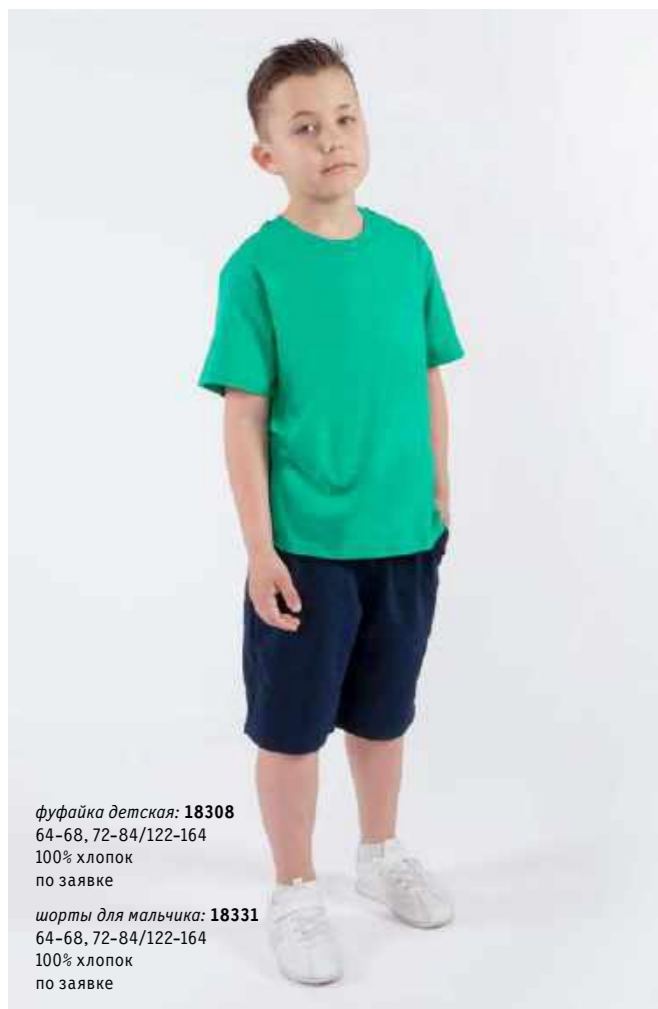
фудайка детская: 18308 64-68, 72-84/122-164 100% хлопок по заявке