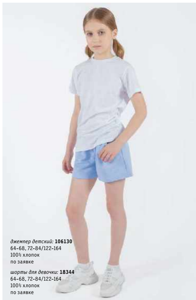
джерпер дeтский: 106130 64-68, 72-84/122-164 100% хлопок по заявке