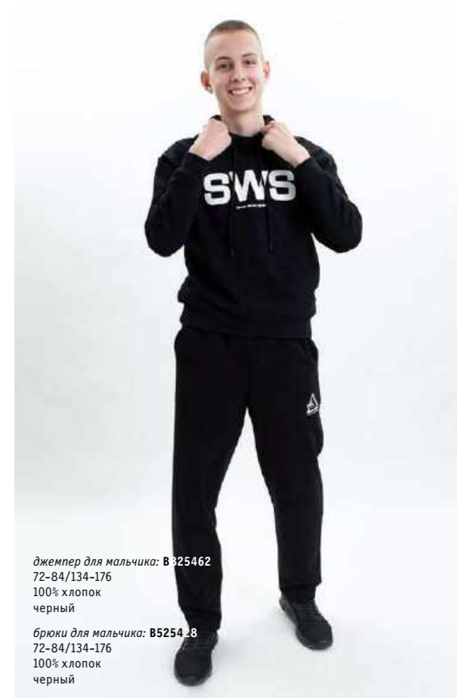
джерсер для мальчика: B325462 72-84/134-176 100% хлопок черный брюки для мальчика: B525448 72-84/134-176 100% хлопок черный