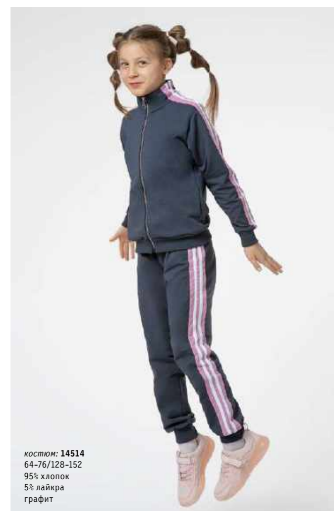
костюм: 14514 64-76/128-152 95% хлопок 5% лайкра графит