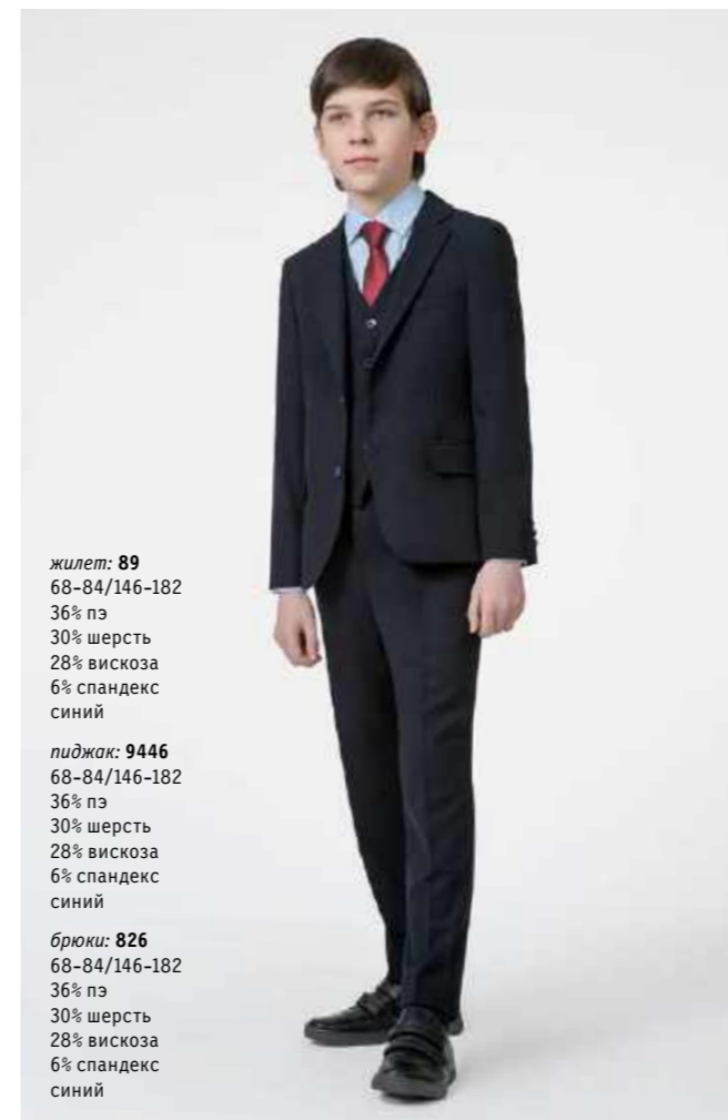
жилет: 89 68-84/146-182 36% пэ 30% шерсть 28% вискоза 6% спандекс синий пиджак: 9446 68-84/146-182 36% пэ 30% шерсть 28% вискоза 6% спандекс синий брюки: 826 68-84/146-182 36% пэ 30% шерсть 28% вискоза 6% спандекс синий