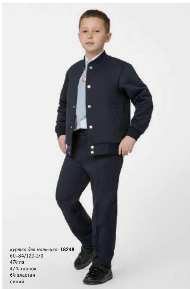
куртка для мальчика: 18248 60-84/122-170 47% пэ 47% хлопок 6% эластан синий