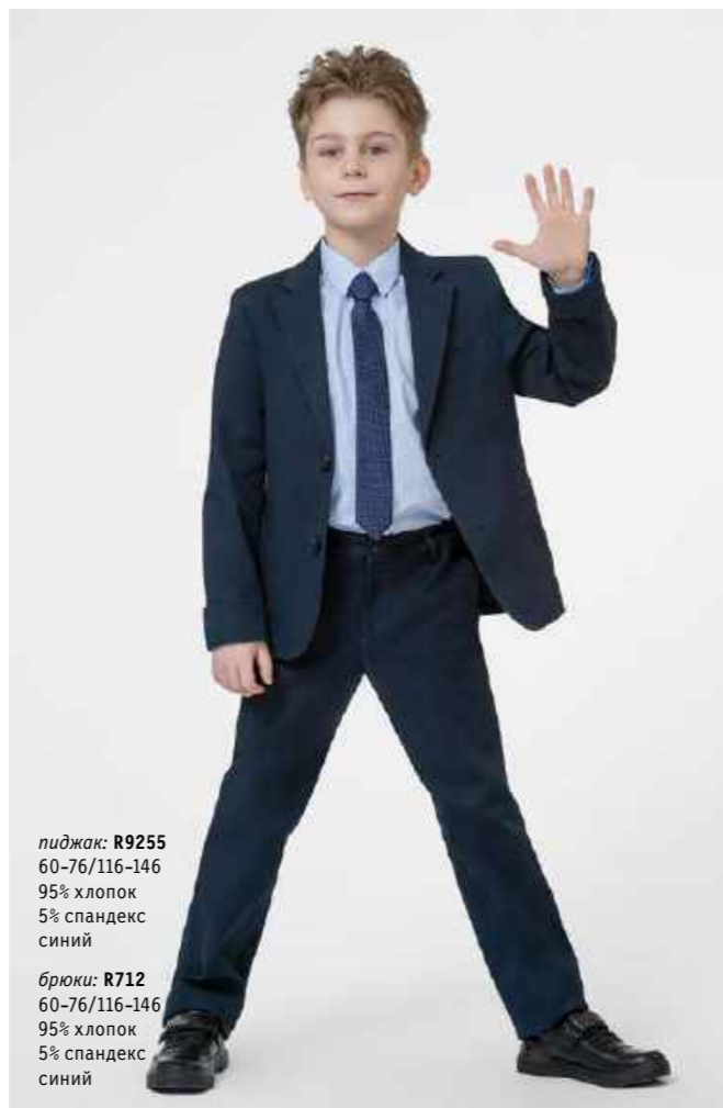
пиджак: R9255 60-76/116-146 95% хлопок 5% спандекс синий брюки: R712 60-76/116-146 95% хлопок 5% спандекс синий