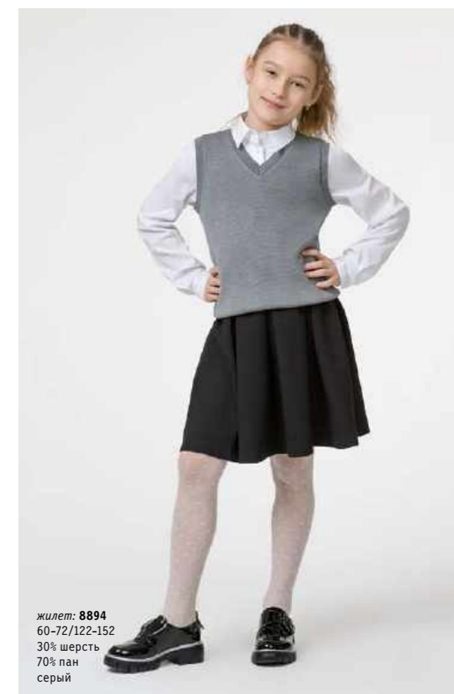
жилет: 8894 60-72/122-152 30% шерсть 70% пан серый