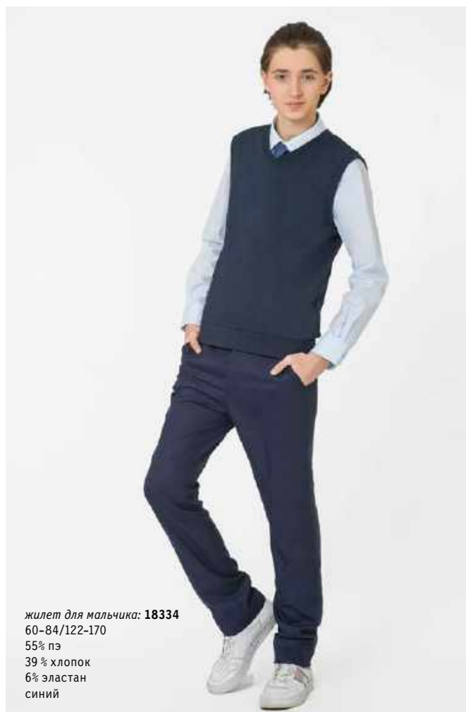
жилет для мальчика: 18334 60-84/122-170 55% пэ 39% хлопок 6% эластан синий