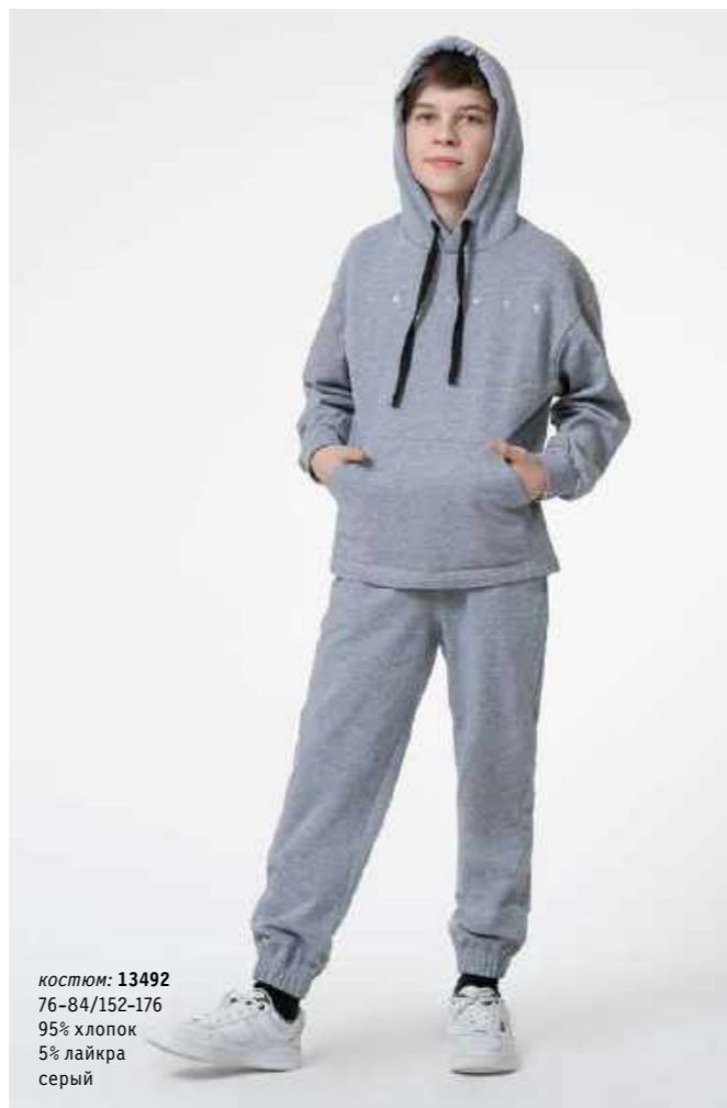
костюм: 13492 76-84/152-176 95% хлопок 5% лайкра серый