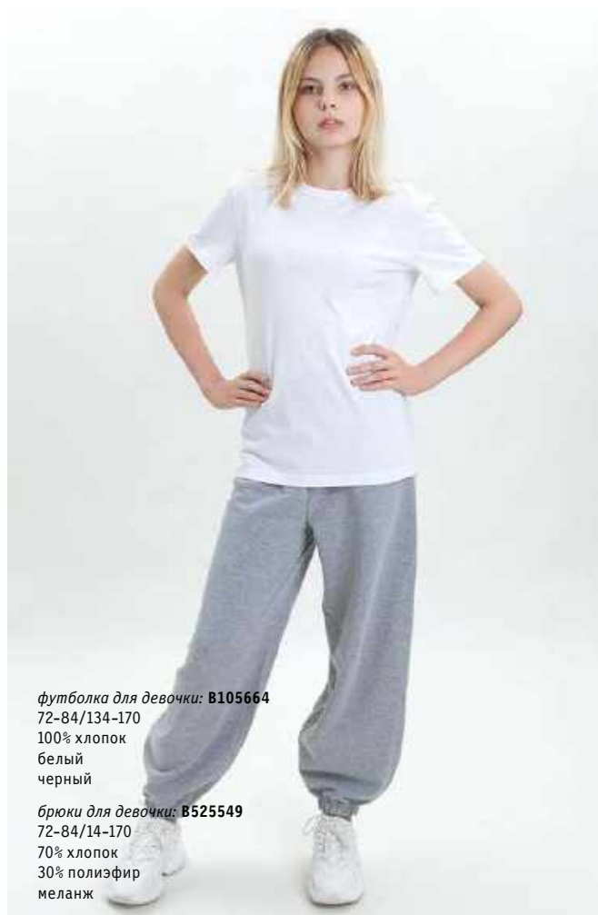
футболка для девочки: B105664 72-84/134-170 100% хлопок белый черный брюки для девочки: B525549 72-84/14-170 70% хлопок 30% полиэфир меланж