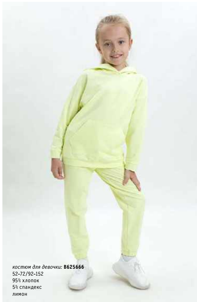
костюм для девочки: B625666 52-72/92-152 95% хлопок 5% спандекс лимон