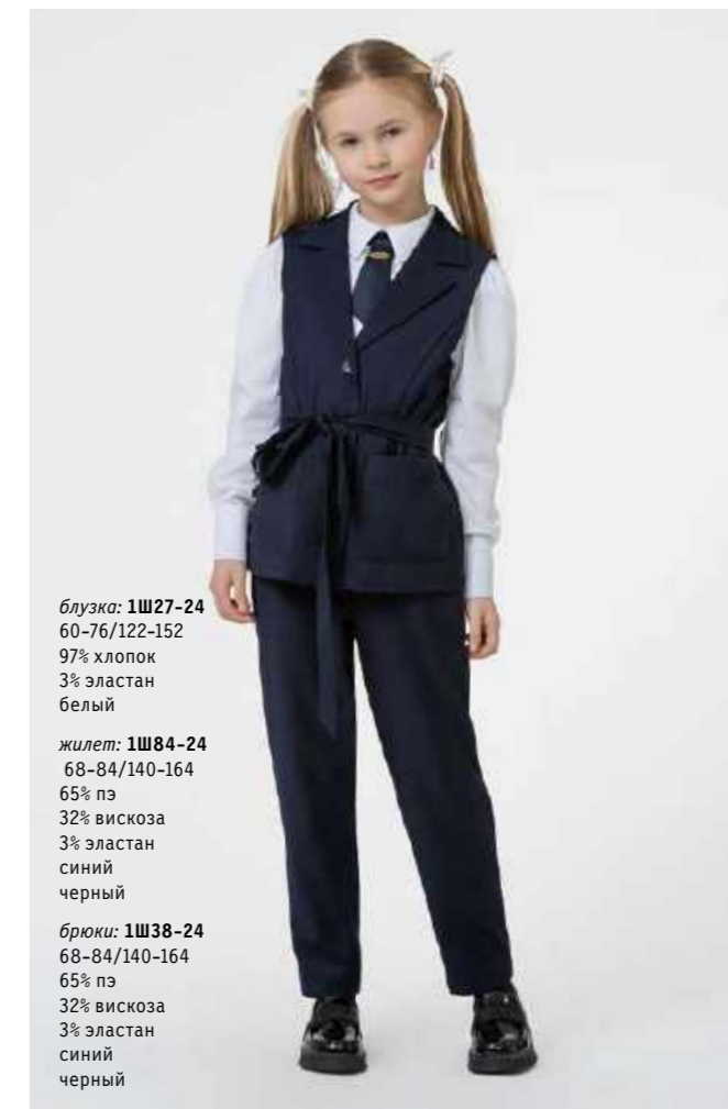
блузка: 1Ш27-24 60-76/122-152 97% хлопок 3% эластан белый жилет: 1Ш84-24 68-84/140-164 65% пэ 32% вискоза 3% эластан синий черный брюки: 1Ш38-24 68-84/140-164 65% пэ 32% вискоза 3% эластан синий черный