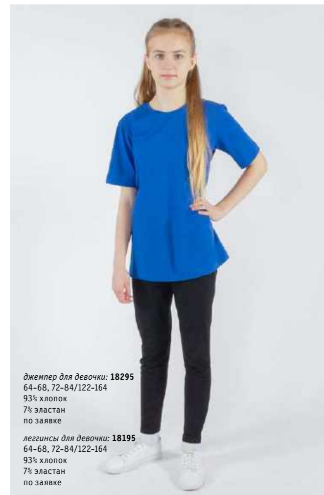
джерпер для девочки: 18295 64-68, 72-84/122-164 93% хлопок 7% эластан по заявке