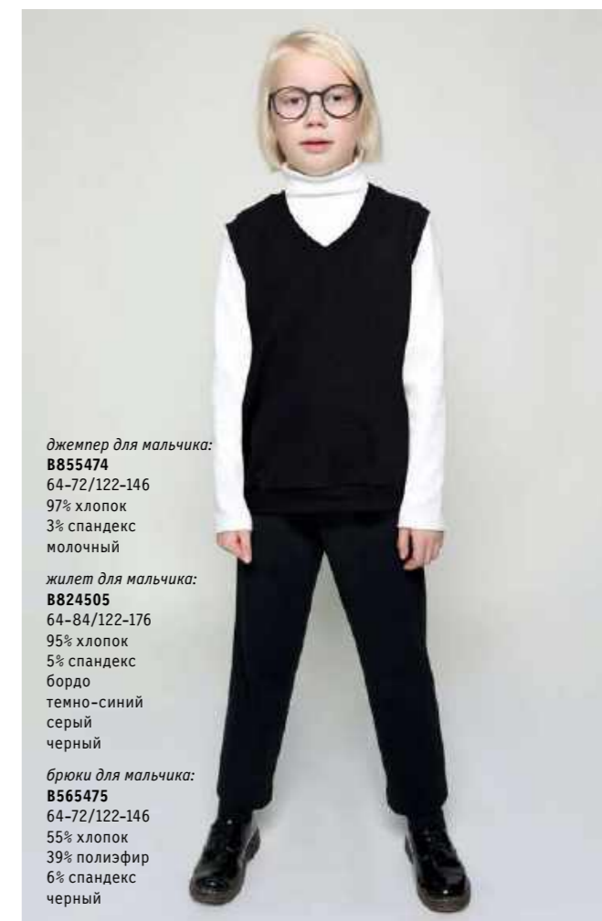
джерсер для мальчика: В855474 64-72/122-146 97% хлопок 3% спандекс молочный