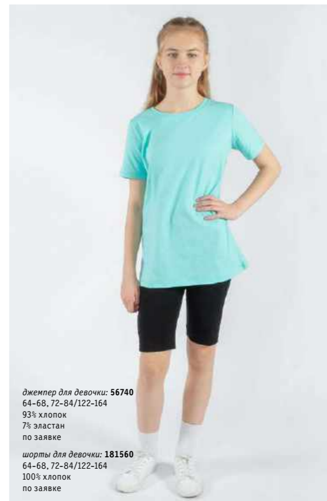
джерпер для девочки: 56740 64-68, 72-84/122-164 93% хлопок 7% эластан по заявке