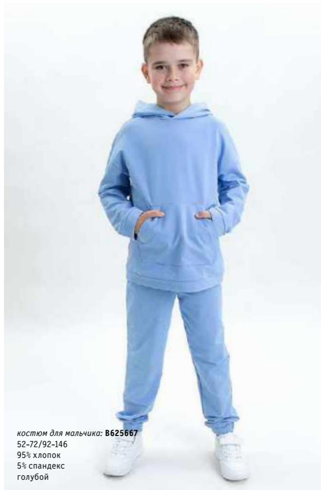
костюм для мальчика: B625667 52-72/92-146 95% хлопок 5% спандекс голубой