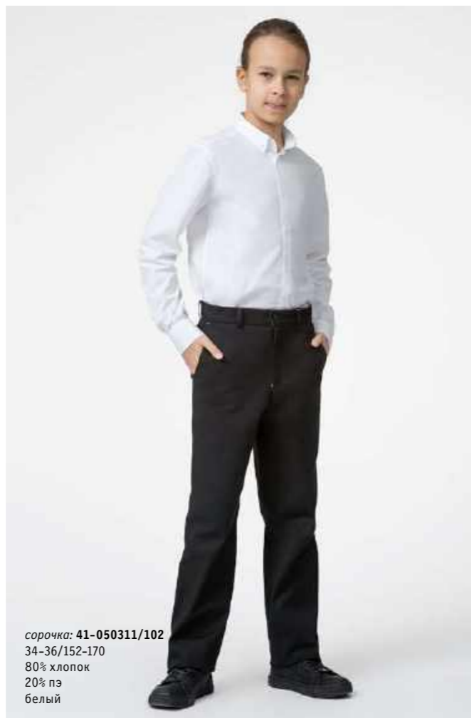
сорочка: 41-050311/102 34-36/152-170 80% хлопок 20% пэ белый