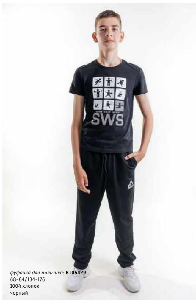
фудайка для мальчика: B105429 68-84/134-176 100% хлопок черный