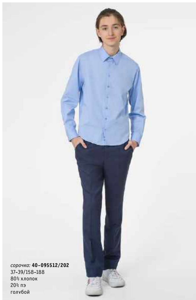
сорочка: 40-095512/202 37-39/158-188 80% хлопок 20% пэ голлбой