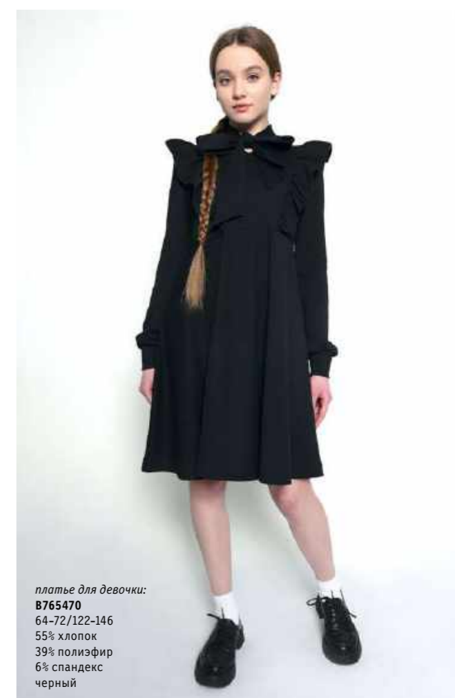
платье для дівочки: В765470 64-72/122-146 55% хлопок 39% поліэфир 6% спандекс черный