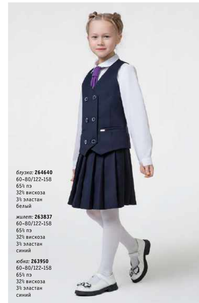
блузка: 264640 60-80/122-158 65% пэ 32% вискоза 3% эластан белый