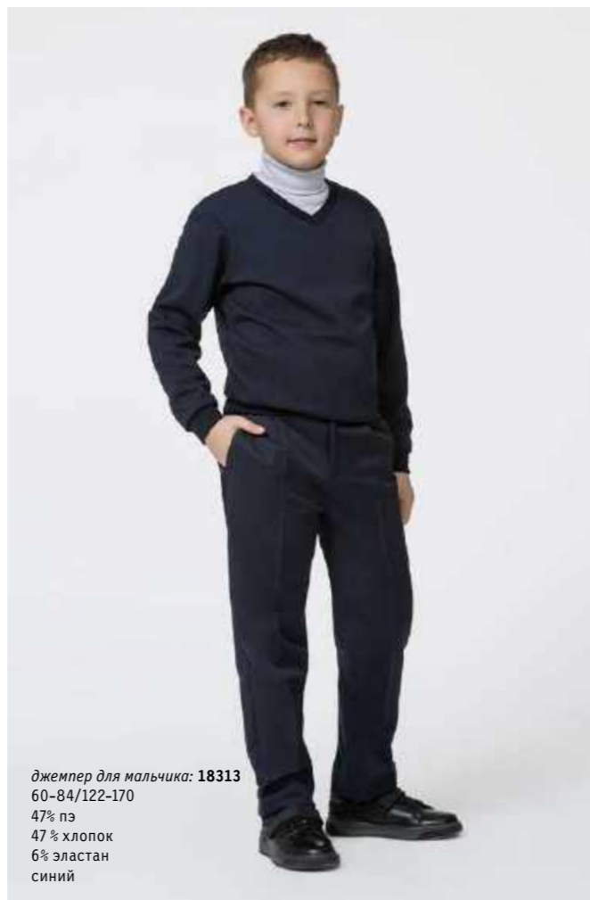
джерпер для мальчика: 18313 60-84/122-170 47% пэ 47% хлопок 6% эластан синий