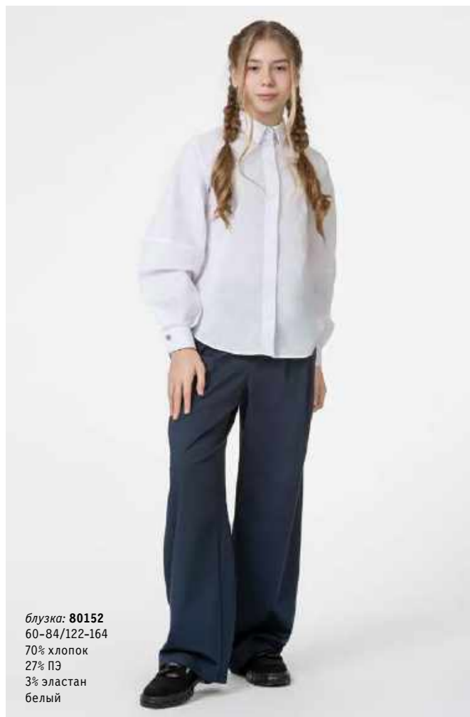
блузка: 80152 60-84/122-164 70% хлопок 27% пэ 3% эластан белый