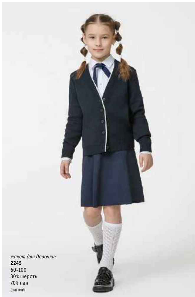
жакет для девочки: 2245 60-100 30% шерсть 70% пан синий