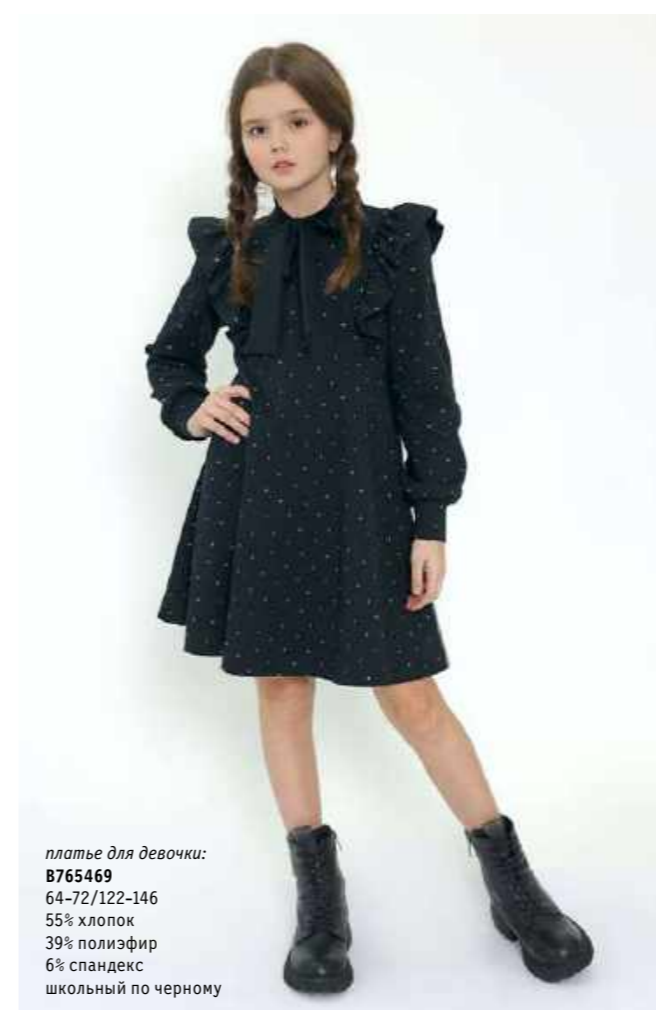
платье для дівочки: В765469 64-72/122-146 55% хлопок 39% поліэфир 6% спандекс школьный по черному

Благодаря хлопку полотно обладает гигиеничностью, хорошо пропускает воздух, а нити полиэфира и спандекса помогают долго сохранить свою первоначальную форму и насыщенность цвета.