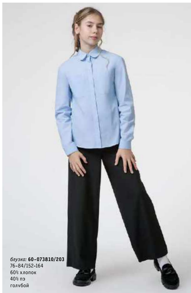
блузка: 60-073810/203 76-84/152-164 60% хлопок 40% пэ голлбой