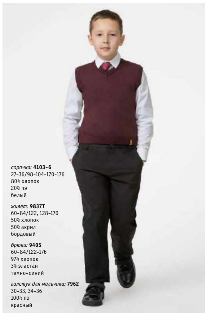
сорочка: 4103-6 27-36/98-104-170-176 80% хлопок 20% пэ белый