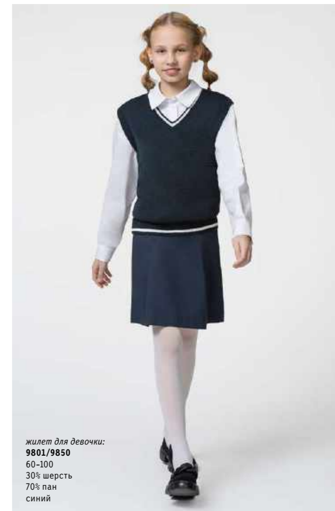
жилет для девочки: 9801/9850 60-100 30% шерсть 70% пан синий