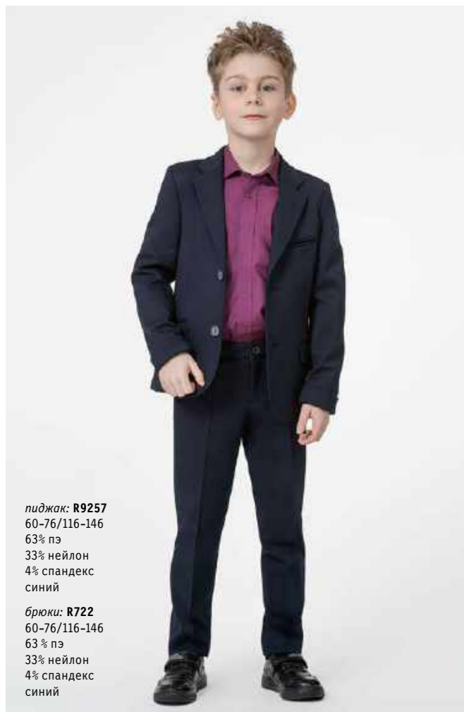
пиджак: R9257 60-76/116-146 63% пэ 33% нейлон 4% спандекс синий брюки: R722 60-76/116-146 63% пэ 33% нейлон 4% спандекс синий