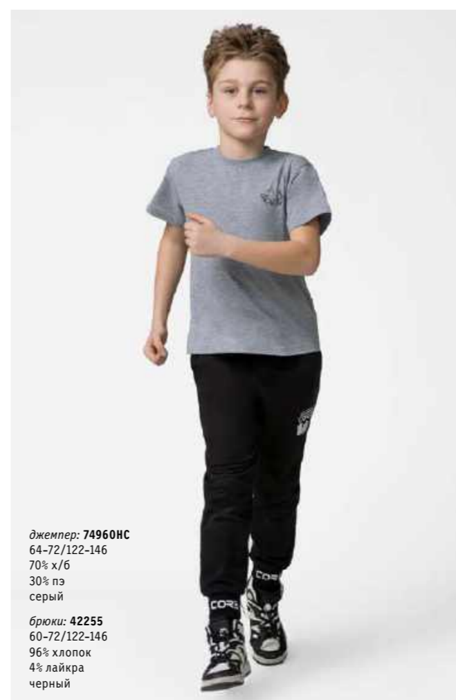
джемпер: 74960НС 64-72/122-146 70% х/б 30% пэ серый

Будьте смелыми, уверенными и готовыми к новым вызовам в одежде от ОАО «Бобруйсктрикотаж».