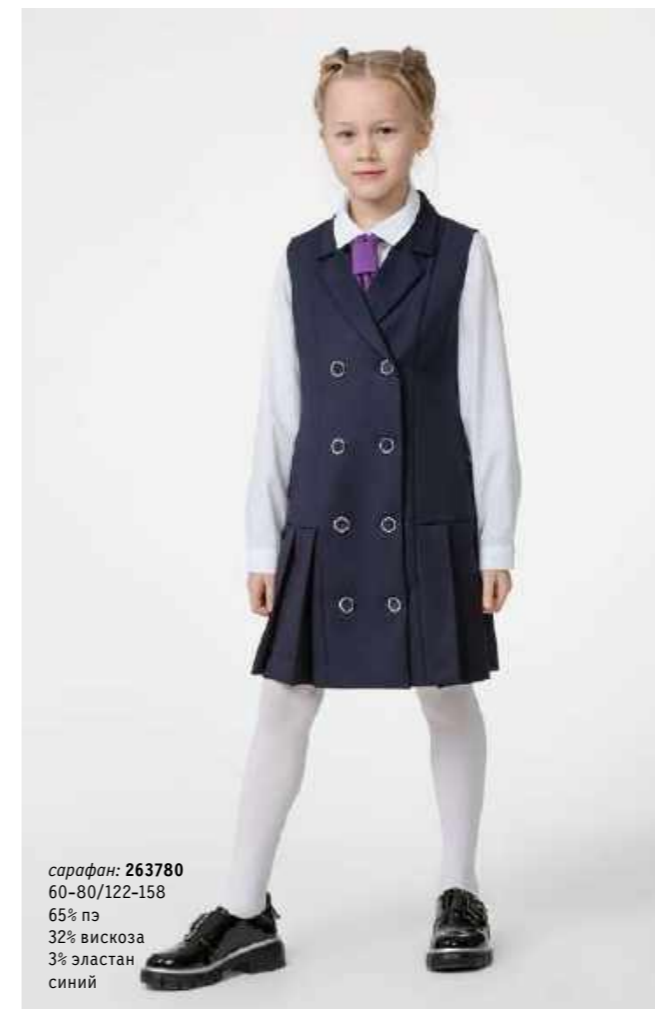
сарафан: 263780 60-80/122-158 65% пэ 32% вискоза 3% эластан синий