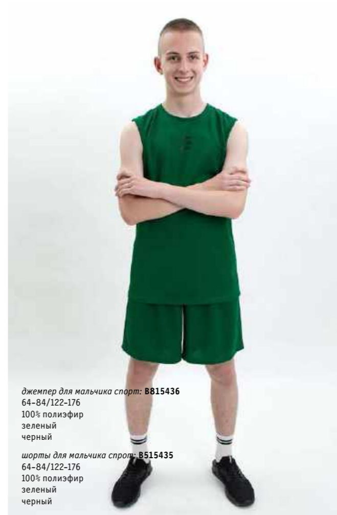
джерсер для мальчика спорт: B815436 64-84/122-176 100% полиэфир зеленый черный шорты для мальчика спорт: B515435 64-84/122-176 100% полиэфир зеленый черный